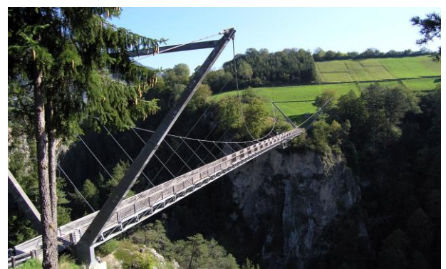
Benni Raich Brücke

Wir freuen uns auf Sie. Für Information und Buchung • 044 720 14 66 • bus@fankhauser.net info@doenni-roesli-carreisen.ch • www.doenni-roesli-carreisen.ch